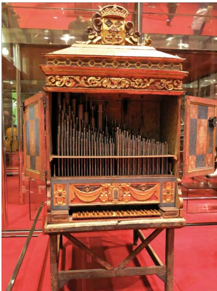
UN ORGANO POSITIVO DEL XVII SECOLO

Nell'Ottocento la banda, da formazione ristretta e al servizio di corti e potentati, diventa formazione di massa a servizio della collettività e come mezzo di comunicazione. Riconquistando la piazza, la banda dava la possibilità a tutti, soprattutto alle classi meno abbienti, che non potevano permettersi di andare a teatro e nelle sale da concerto, di accostarsi alla musica colta, sia essa strumentale che operistica. Un aspetto negativo di questa situazione fu che il gran numero di trascr-