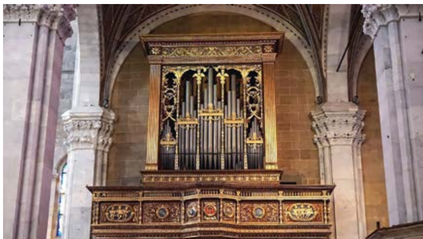
ORGANO DELLA CATTEDRALE DI LUCCA