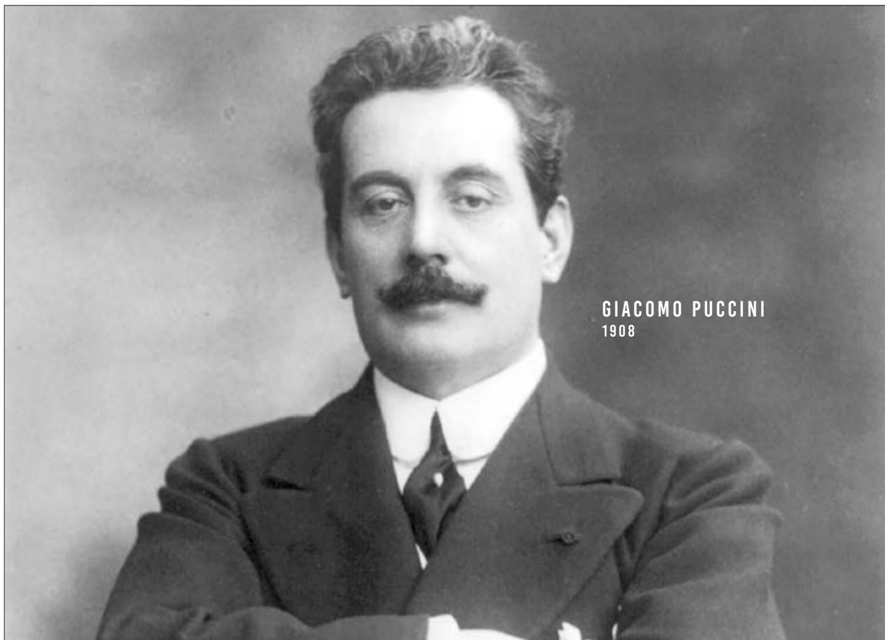
GIACOMO PUCCINI 1908

I festeggiamenti per il Primo Centenario della morte di Giacomo Puccini (1858-1924) ci offrono l'occasione per riflettere sulla musica corale presente nelle sue opere e in altre sue composizioni minori. Il rapporto tra parola e musica è un tema presente anche nelle composizioni vocali di Puccini, l'ultimo grande operista italiano. L'elemento essenziale di questo rapporto è lo stretto legame tra la metrica del testo letterario e la musica che lo accompagna.