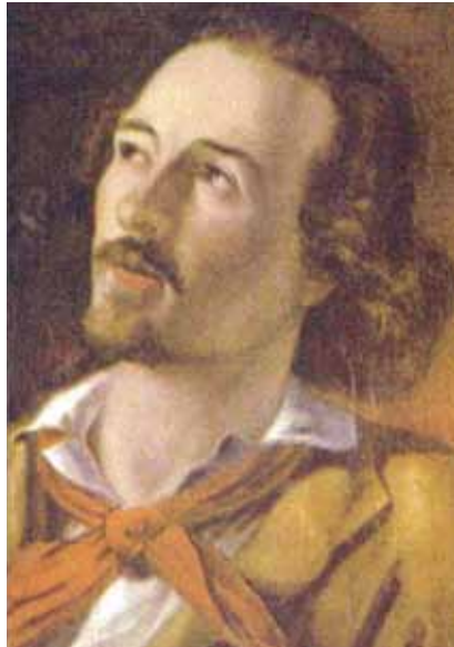
Versi di Goffredo Mameli