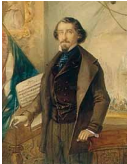
Musica di Michele Novaro

Orchestrazione ed elaborazione di Nino Mameli