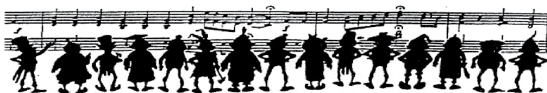
Musica in terapia