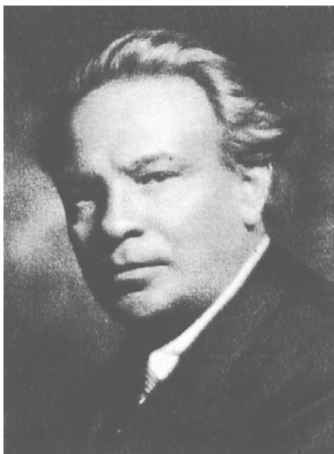
OTTORINO RESPIGHI